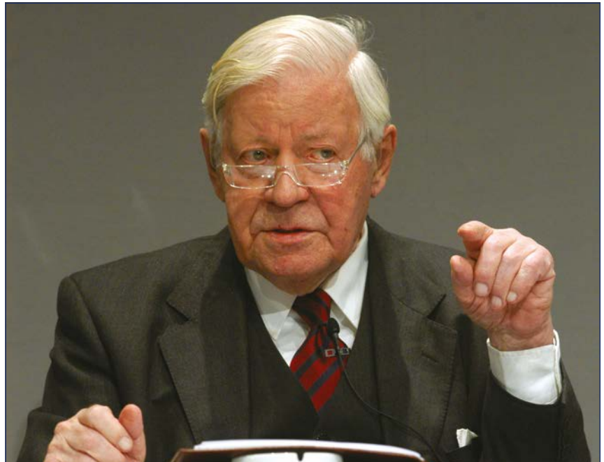
Helmut Schmidt, Bundeskanzler a. D.