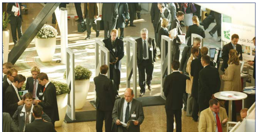
Zugangskontrolle mit RFID-Technologie