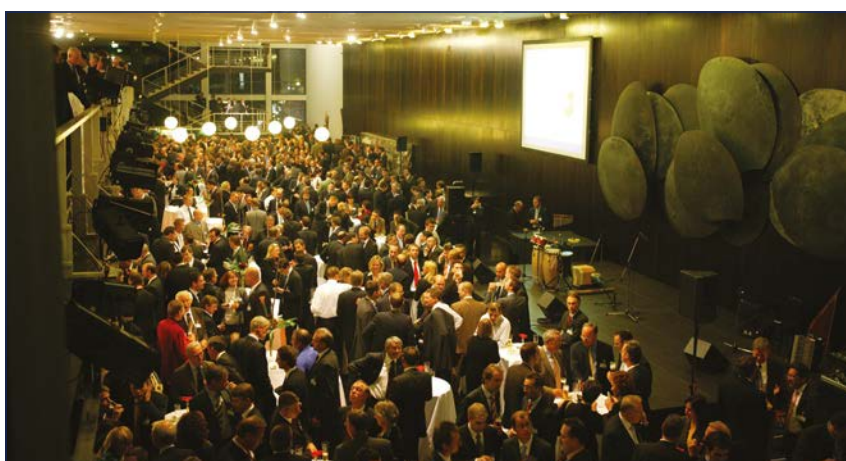
Senatsempfang in der Deutschen Oper