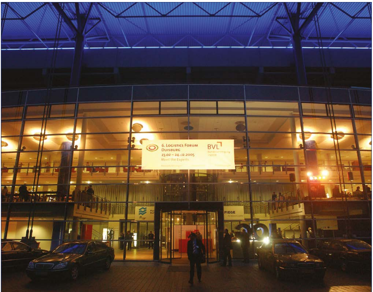
6. Logistics Forum Duisburg in der MSV-Arena