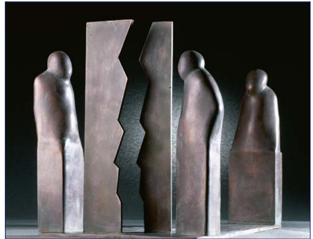
Der Logistics Service Award „Fug und Weg“